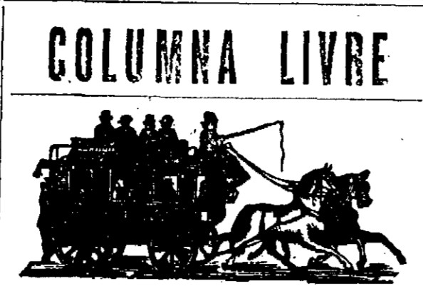
Companhia Ferro Carril da Parahyba